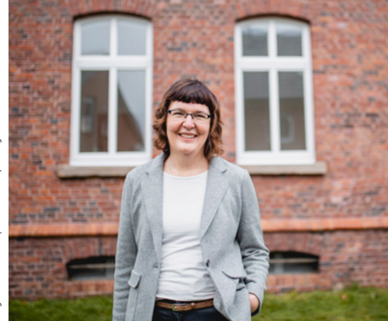
Design: www.3kreativ.de | Fotos: Ellen Hempel | Fotografie